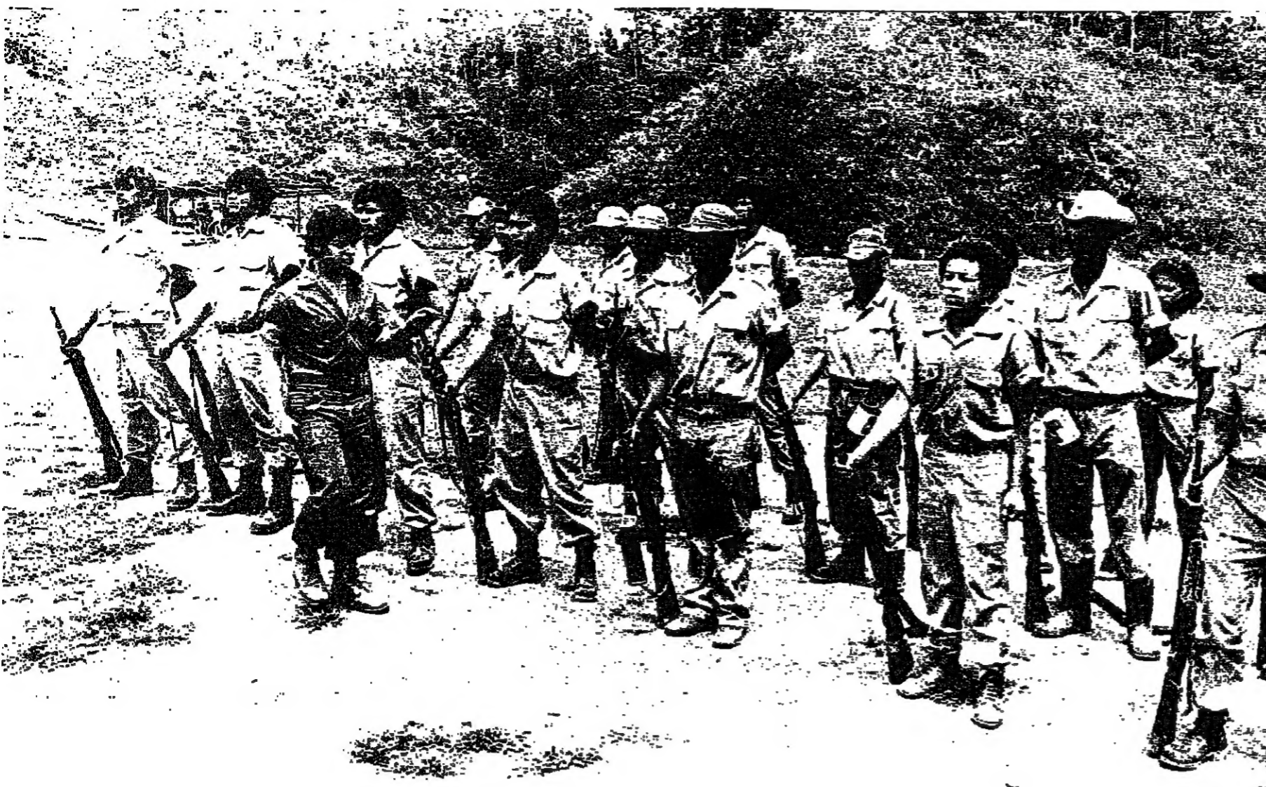
وحدة قتالية تتدرب على حرب العصابات. اطلحة نظام اورتيغا

هندوراس، بالقرب من حدود نيكاراغوا. والتقطت في المرحلة الأخيرة كلمات غامضة تقول ان العام ١٩٨٥ هو عام النصر والحرية لاستقلال نيكاراغوا الجديد. واللات ان - القوة الديمقراطية النيكاراغوية - الخلفت بحركات التمرد الأخرى التي تكاثرت يوميا في نيكاراغوا. وعلى رأسها القائد - ارتورو كروز - يمكنه ١٧ ألف مقاتل. بينهم ٢٠ ألف عنصر من قوى الاستد. وثمة معلومات أخرى يجري تسويقها في ماناغوا. حول إمكانية امتلاك - القوة الديمقراطية النيكاراغوية - نحو ٤٠ ألف مقاتل في الأشهر الستة المقبلة. إضافة إلى ترسانة السلاح المتطورة... الامر الذي يمكنها من انتزاع الانتصار على نظام الرئيس اورتيغا الملقب بالقائد صفر. كل المؤشرات تدل ان الاعداد الأخيرة من المتطوعين الذين لحقوا إلى معسكرات التدريب التابعة - القوة الديمقراطية النيكاراغوية - هم - في غالبيتهم - من الجنود المتطوعين الذين فروا من القوات الشرعية. والتحقوا بقواعد - شديدة التميؤ - مزروعة في مهب الإصراع.